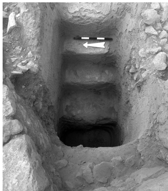
איור 2: מקווה L6667 שביסודותיו התגלתה קערת הקירטון

קערת הקירטון התגלתה מתחת ליסודותיו של מקווה טהרה L6667 (איור 2). מקווה זה הוא חלק ממכלול מורכב של מתקני מים שנחפרו בעונת 2015 בחניון גבעתי והם מצטרפים למתקנים דומים שנחפרו בסמוך בעונות קודמות. הם כוללים מקוואות, בורות מים ותעלות המקשרות ביניהם ויחדיו הם משמשים חלק ממכלול טהרה רחב ידיים המתוארך לתקופה הרומית הקדומה (שכבה VII; בן עמי 2013: 22–31). הימצאותה של קערת הקירטון נושאת הכתובת ביסודותיו של המקווה הנדון מאפשרת לקבוע את ייסודו כ-terminus ante quem ביחס לזמן השימוש בקערה. אפשר אפוא להניח שתאריך ייצורה קודם למאה הא' לספירה, זמנה של שכבה VII (וראו להלן).