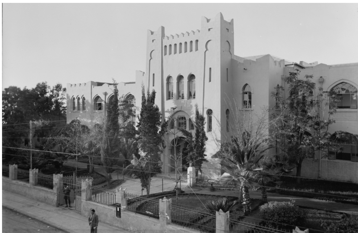
בניין "גימנסיה הרצליה", שנת 1936