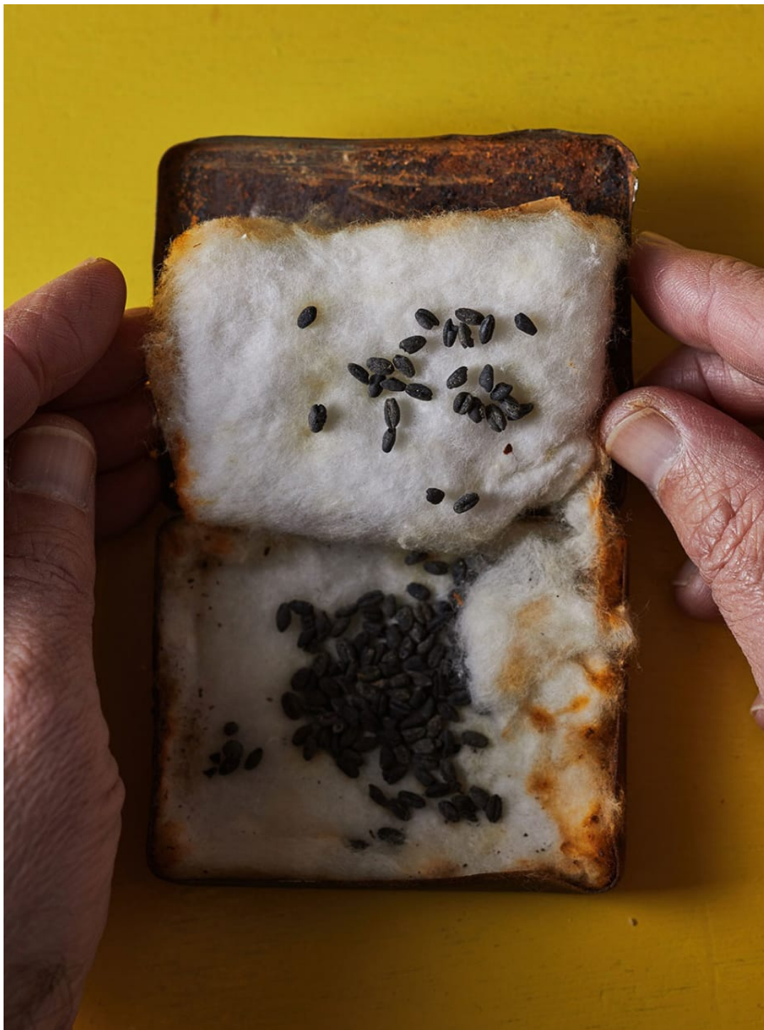
גרעיני חיטה מתקופת הברזל שנמצאו במגידו

חוקרי המעבדה ותלמידיה משתתפים — לצד ארכיאולוגים המתמחים בזואולוגיה, בארכיטקטורה או באמנות עתיקה — במשלחות חפירה החושפות את שרידי העבר. "לא הכל נרקב", מסביר ויס. "יש זרעים שמשתמרים בגלל תנאי אקלים קיצוניים כמו יובש או קור, ויש זרעים שמשתמרים בגלל תהליכי פיחום. כשנבוכדנצר הגיע לארץ ישראל חייליו שרפו יישובים ובתים על תכולתם, וכאשר קירות קרסו, והתירו רק למעט חמצן להיכנס, נוצר תהליך של פיחום שמשמר גזעי עצים וזרעים כפי שהיו מבחינה מורפולוגית. ארץ ישראל, הן מבחינת אקלים והן מבחינת היסטוריה רצופה בקרבות, פלישות וכיבושים, היא תיבת אוצר של ממצא בוטני מהעבר".