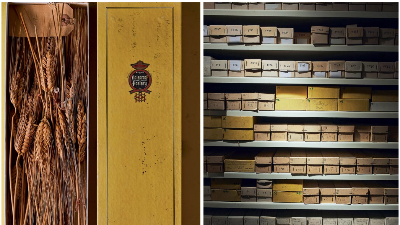
האוסף של פינר. משמאל: שיבולים וגרעיני חיטה מתקופת הברזל שנמצאו במגידו

הפתקיות הלבנות המודבקות לקופסאות הקרטון המשרדיות, כתובות בכתב יד או מודפסות בפונט פשוט, מציינות בתמציתיות שמות כמו "מצדה", "עיר דוד" "תל צפית" ו"אוהלו". בתוך כל אחד מהארגזים, המוחזקים על אצטבאות מתכת גבוהות, נתונות מעטפות נייר וקופסאות המכילות רסיסי מידע ופיסות סיפורים — בדמות זרעים מפוחמים או חלקי צמחים יבשים אחרים — שנתגלו בחפירות ארכיאולוגיות ברחבי ארץ ישראל. אם זרעים חיים הם קפסולות ידע שאוצרות בתוכן את הידע הגנטי של צמחים, הרי שזרעים שנמצאו בחפירות ארכיאולוגיות הם כמוסות ידע שמעידות גם על חיי החומר והרוח של האנשים שליקטו, אכלו וגידלו אותם. השרידים הזעירים האלה — חרצני זיתים שנאכלו ונזרקו לפני 8,000 שנה, או גרעיני חיטה ששימשו תושבים קדמונים למאכל או להפקת קמח ללחם — מרגשים לא פחות מצלמיות או מכדים מפוארים שהתגלו בחפירות.