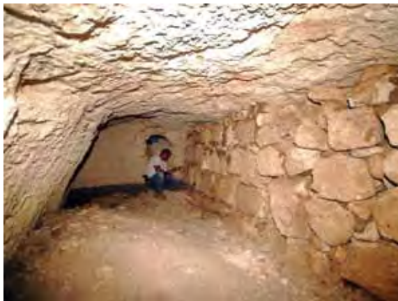
איור 7: פתח של מחילה הפורצת מתקן קדום במערכת המסתור

המערכת התת־קרקעית (לעיל) מורכבת ממספר חללים חצובים, לרוב מחסנים תת־קרקעיים (איור 7), שחוברו באמצעות פרצות ומחילות צרות ומפותלות, בהם נתגלו אמצעי חסימה. גילוי מחילות אופייניות לצד זיהוי מאפיינים טיפולוגיים המוכרים ממערכות המסתור הנפוצות בשפלת יהודה, מאפשרים להגדיר