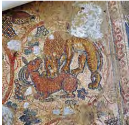
איור 9: מדליון המאוכלס באריה הטורף יעל או יחמור, ברצפת הפסיפס של האולם

האולם המרכזי עוטר בשטיח, ובו משתרגת גפן היוצרת מדליונים מאוכלסים בחיות או בסלי פרות. בקטע הפסיפס