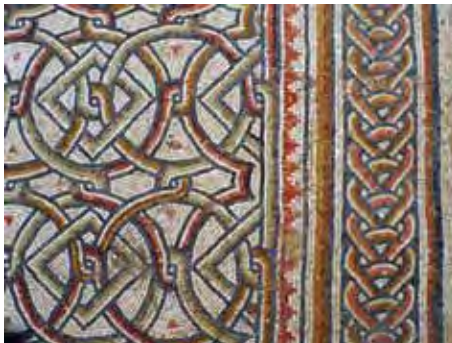
איור 13: שטיחי פסיפס בעלי דגמים גאומטריים בסטרה הדרומית

שנחשף במערב האולם השתמרו שתי שורות בנות שלושה מדליונים בכל שורה. בשורה התחתונה אוכלסו המדליונים הקיצוניים בסלי פרות. הסל הדרומי גבוה ובו אשכול ענבים, רימון, ותאנים (?). הסל במדליון הצפוני רחב ופתוח. הוא מתואר כאילו הוא רופד בחלקו הפנימי בעלים שעליהם הניחו את הפרות ואת הירקות שבטנא. בין הפרות השונים ניתן לזהות רימון, אתרוג, תאנים וירק הדומה לקישוא. המדליון שהיה בין הטנאים לא השתמר. בשורה השנייה, במדליון הדרומי מאוכלסים אריה הטורף חיה בעלת קרניים ארוכות, יעל או יחמור. במדליון שמצפון לאריה הטורף השתמר באופן חלקי גוף של חיה בגוון חום־אדמדם, כנראה שור המביט לאחור. מן המדליון הצפוני שבשורה השנייה שרדה רק כף רגל צהובה עם ציפורניים, כך שברור שהמדליון אוכלס חיה טורפת ממשפחת החתוליים (אריה נוסף או נמר). מחוץ למדליונים שיצרה הגפן, בין המדליון של האריה הטורף והחיה האדומה ומעליו, השתמר גוף של ציפור שראשה לא שרד. ציפורים בדגם זה נמצאות גם בשני שטיחים מלבניים שהונחו בסטראות.