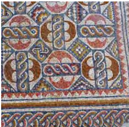
איור 12: שטיחי פסיפס בעלי דגמים גאומטריים בסטרה הדרומית