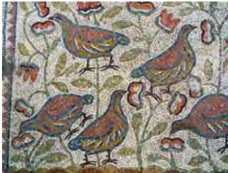
איור 14: שטיחי פסיפס מעוטרים בחוגלות בסטרה הדרומית

בשתי הסטראות יש שטיח בדגם זהה המבוסס על דגם של גרזנים בעלי ראש כפול מחוברים לידית מעוטרת בדגם חבל (איור 12). באגף הדרומי ישנם שני שטיחים מלבניים