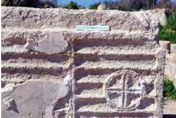
איור 16: פרט: חלק מאומנה מגולפת המעוטרת בצלב בתוך מדליון ודגם מחורץ; האומנה כוסתה בשלב מאוחר בטיח.

היווניות X ו-R, קיצור השם כריסטוס) נמצאו במפולת שבאגף הדרומי (איור 16). באומנות אלו ישנן גומות המעידות על שלב בו תוקן הקירוי שמעל הסטרה הדרומית. בשלב מאוחר יותר טווחו האומנות בשכבה דקה של טיח לבן שהסתיר את הצלבים. ייתכן שמלאכה זו נעשתה על ידי מוסלמים שהשתמשו גם כן במבנה הכנסייה.