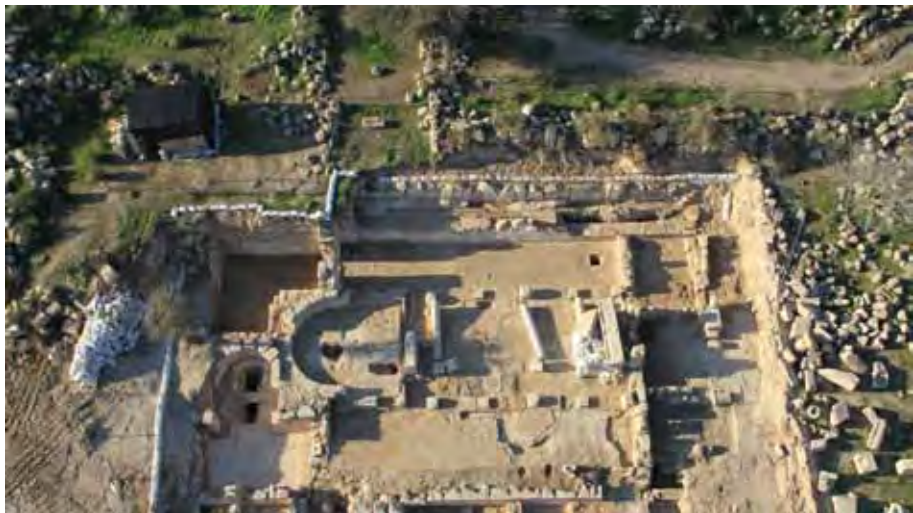
איור 3: הכנסייה בסוף החפירות, אביב 2011, צילום אוויר, מבט לכיוון דרום