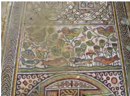
איור 15: שטיח פסיפס המעוטר בנוף נילוטי בסטרה הדרומית

ובהם דמויות של בעלי חיים. בשטיח המזרחי מתוארות חוגלות בין שיחים בעלי פרחים אדומים (איור 14), ואילו במערבי מתואר נוף של ביצה או חוף אגם, מעין נוף נילוטי נטול סממנים המזהים אותו עם אלכסנדריה (איור 15). בתחתית יש קו גלי בגוני ירוק ואפור המייצגים נחל או אגם, מעליו שני זוגות של דגים שוחים כלפי המרכז, ומעליהם צומחים שיחי לוטוס בעלי פרחים הנמצאים בשלבי פריחה שונים. בחלק העליון ישנם שלושה זוגות של ציפורים המקננות, כל זוג על פרח לוטוס משלו.