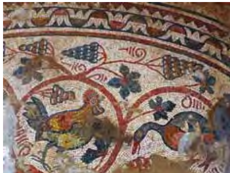
איור 10: ברווז ותרגול באפסיס