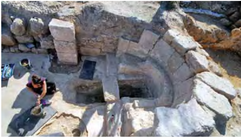
איור 4: המרטיריון מצפון לאפסיס, במבט למזרח; הפרוזדור המדורג יורד דרומה אל מערת הקבורה. מעליו הותקן אגן טבילה

התוחם במזרח את שני החדרים שמצדי האפסיס. לשניהם תכנית דומה: לחדר שמדרום תכנית בצורת האות העברית 'ר', ואילו לחדר שמצפון תכנית בצורת האות היוונית Γ. החדר שמדרום לאפסיס הוא החדר היחיד בתוך הכנסייה שרוצף שיש. עובדה זו מעידה על חשיבותו. ייתכן שבחדר הוצג שריד קדוש (relic) על גבי מתקן נייד. גם החדר שמצפון לאפסיס היה בעל חשיבות מיוחדת, משום שלקיר הדרומי פן פנימי מעוגל ומעוטר בכרכוב. באזור זה של החדר נמצא פרוזדור עם מדרגות שירדו דרומה, אל הקבר הריק משלב 3. נראה שהקבר היווה את העילה לבניית הכנסייה, שכן הוא ממוקם מתחת לאפסיס. בשלב הראשון (שלב 4) נעשה המעבר אל החדר הצפוני דרך האגף הצפוני שבכנסייה, באמצעות פתח בקיר המזרחי של הסטרה. הפער במפלס הרצפות חייב מדרגות, אולי מעץ, שבהן ירדו מהאגף הצפוני אל החדר ובו הפרוזדור לקבר הריק (איור 4). החדר רוצף בפסיפס לבן שלא נחפר. אי לכך לא ברור אם רצפת הפסיפס הזו שייכת לשלב 4 או