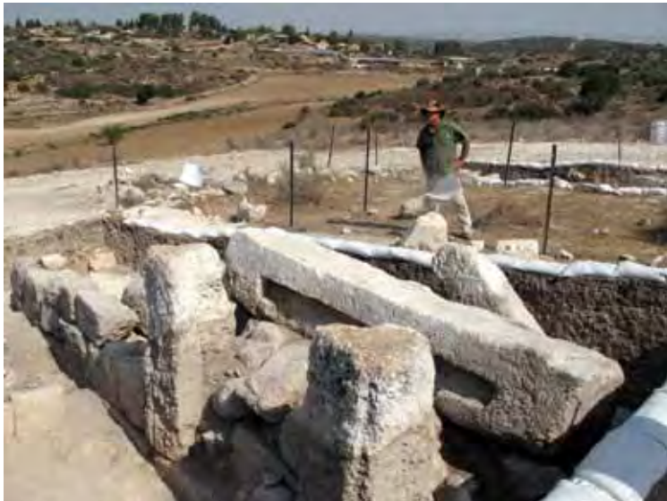
איור 1: משקוף מונומנטלי הניצב מעל מזוזות הפתח המרכזי של המבנה, בתחילת החפירה

בעקבות חפירות שוד בקרבת המשקוף המונומנטלי (לעיל) הוחלט לבצע חפירת הצלה במקום (איור 1). המאמר הנוכחי הנו דיווח ראשוני על חפירה זו, שנערכה בחודשים אוגוסט, דצמבר 2010 וינואר 2011. 1