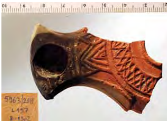
איור 8: נר יהודאי ('דרום') מימי מרד בר־כוכבא, ממערכת המסתור, חותרת קורינטית ועמוד במפולת, באתרם, באולם הכנסייה

הממצא הקטן שנתגלה בחדרי מערכת המסתור שייך ברובו לשלב השימוש האחרון במערכת, בימי מרד בר־כוכבא. הדבר עולה מבחינת שברי כלי